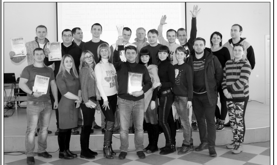
Победитель XIV спартакиады агропромышленной группы БВК – сборная команда АО «БВК трейд», управляющей компании и предприятий-партнёров со своей группой поддержки.