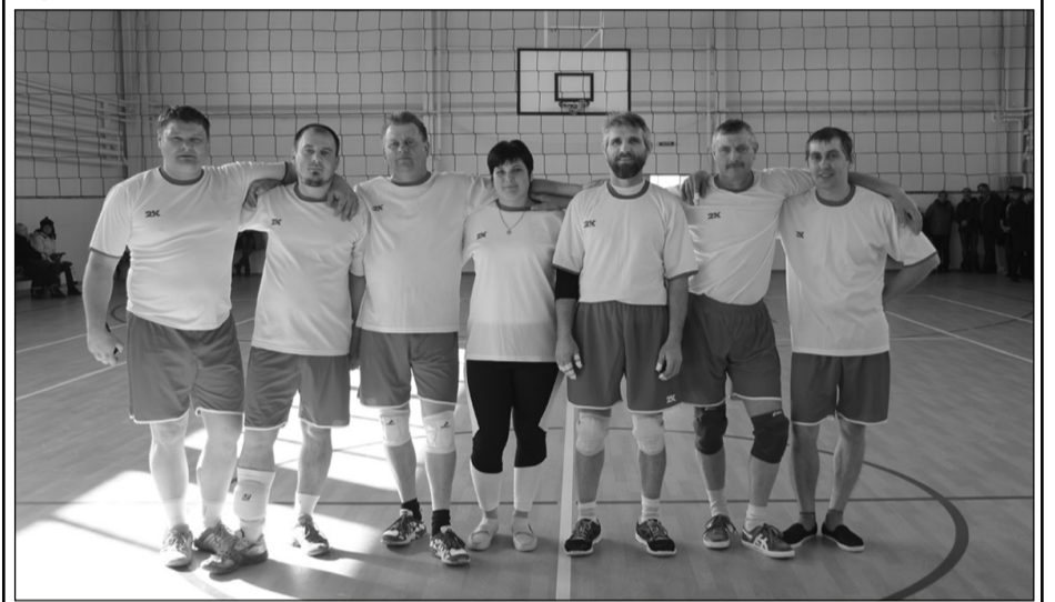
Волейболисты команды сельскохозяйственных предприятий, занявшие первое место в этом виде соревнований.

В итоге лидером в этом виде спорта стала команда сельскохозяйственных предприятий, на втором месте волейболисты сборной команды АО «БВК трейд», управляющей компании и предприятий-партнёров, а третий результат у представителей АО «Губкинский мяскокомбинат».