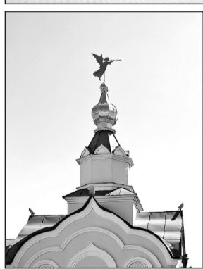
▲ Поминальная часовня увенчана не крестом, а фигурой ангела.

го места была построена часовня, потом церковь. С годами возник и мужской монастырь.