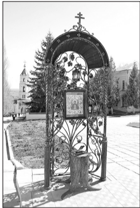
▲ Кованая композиция с копией чудотворной иконы «Знамение».