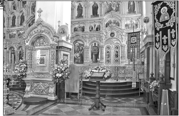
▲ В соборе Рождества Пресвятой Богородицы поразило богатое убранство из живых цветов, а также словно подсвеченная изнутри роспись алтаря.

Затем мы вышли на смотровую площадку, расположенную за главным собором. Впереди расстились дали необозримые. Вроде всё время спускались, но неожиданно оказались на вершине горы! В центре смотровой площадки – скульптура Прохора Мошнина, получившего впоследствии известность под именем Серафима Саровского. Прохор родился и жил в Курске. Родители его попечительствовали строительству Сергиево-Казанского кафедрального собора. Как-то раз Прохор был сильно болен, фак-