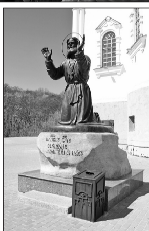
▲ Памятник Серафиму Саровскому.

тически при смерти. Мимо шёл крестный ход – несли икону «Знамение». И мать Прохора умолила зайти с иконой к умирающему сыну. Действительно, вскоре сын пошёл на поправку. Так что памятник стоящему на коленях в месте обретения иконы Серафиму Саровскому как нельзя кстати.