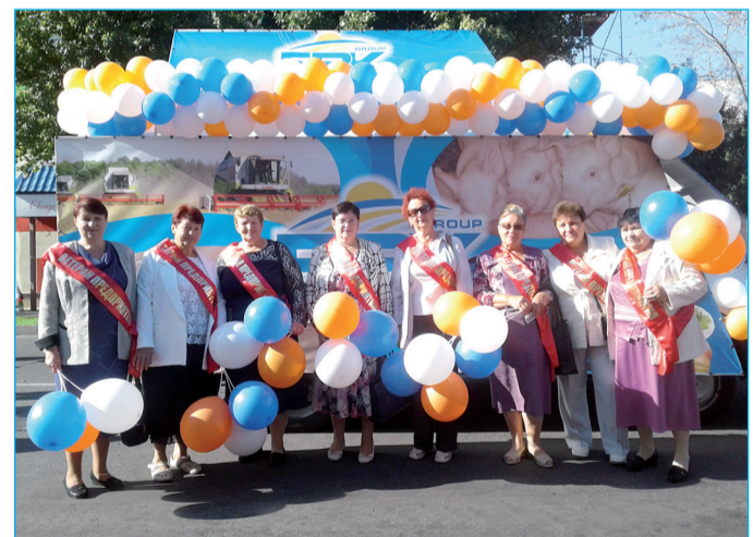
▲ Ветераны предприятий Агропромышленной группы БВК.

лающие смогли полакомиться вкуснейшими блюдами, приобрести душистый мёд, купить диковинные сувенирные вещицы умелых мастеров. На выставке-ярмарке прошли познавательные мастер-классы по рукоделию, все желающие могли познакомиться с народными костюмами, ремёслами, местными обычаями, играми. Насыщенная программа прошла под звуки задорных частушек, фольклорных мотивов. Весь день шли праздничные мероприя-