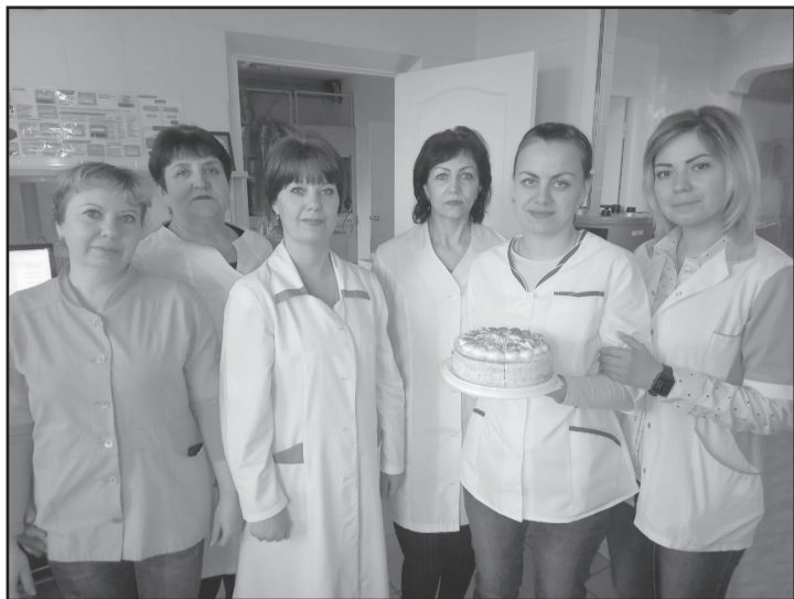
Женский коллектив Троицкого АО «Концорма» (производственно-технологическая лаборатория).

ность объединить- и сердечно поздравили ся, почувствовать мужчин с праздником, себя частью чего-то посвятив каждому из общего, большого, них стихотворение, цельного и интерес- подготовили ориги- ного. В преддверии нальные подарки с Дня защитника От- фирменной продукци- чества сотрудницы ей, угостили вкусной предприятия тепло выпечкой и сочинили