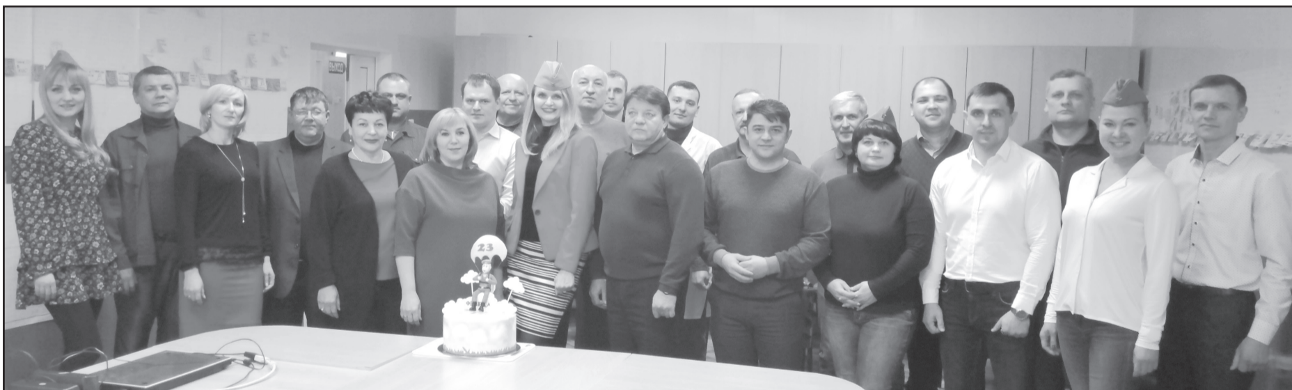
Женский коллектив АО «Губкинский мясокомбинат» поздравляет мужчин-коллег с Днем защитника Отечества.

мятся создавать и поддерживать такие начинания.