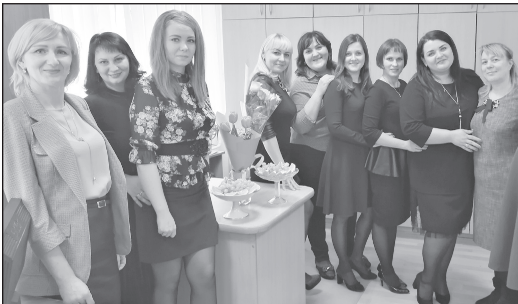
Женский коллектив АО «Губкинский мясокомбинат» принимает поздравления с Международным женским днем.