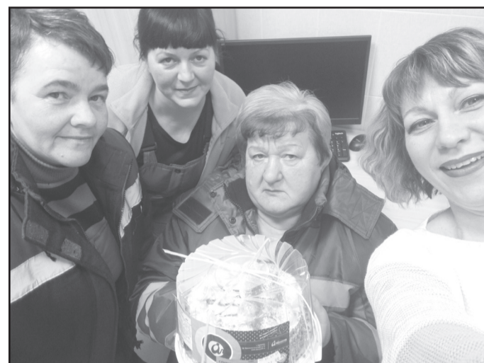
Женский коллектив ООО «Троицкое зерно».

женское лицо, поэтому мужская половина предприятия в канун праздника подарила женщинам-коллегам приятные подарки и цветы.