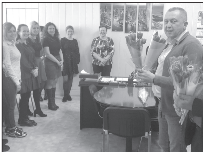
Поздравление специалистов Троицкого АО «Концорма» от руководителей.