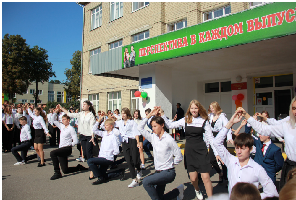
Школьный вальс выпускников МАОУ «Лицей №5».