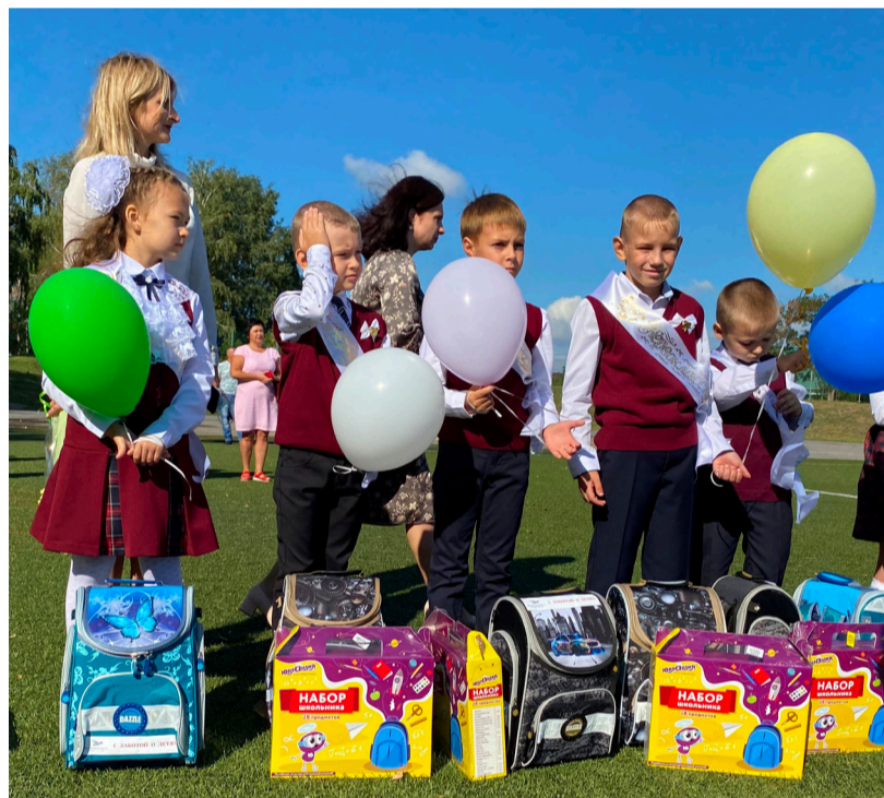
Первоклассники МБОУ «Троицкая СОШ».

Агропромышленная группа БВК уже не первый год оказывает спонсорскую помощь нескольким школам Губкинского городского округа, поэтому присоединилась к этому замечательному празднику.