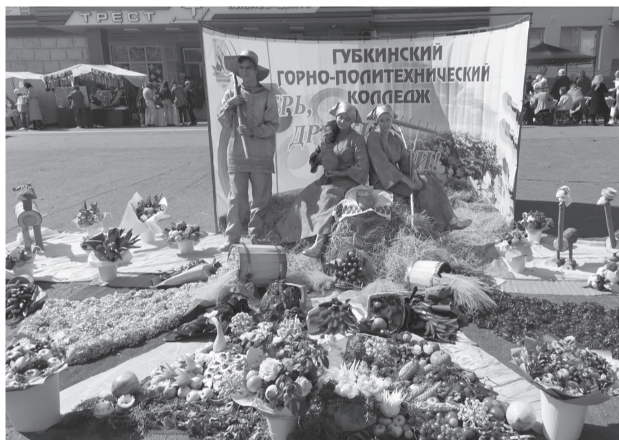
Цветочная композиция Губкинского горно-политехнического колледжа.

Площадь была заполнена разнообразными цветочными композициями представителей жилищно-коммунальных служб, учреждений образования, культуры, предприятий и неравнодушных к ежегодной выставке губкинцев, а это около 150 участников.