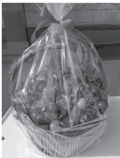
Приз Губкинского мясокомбината - корзина колбас и колбасных деликатесов.

4 сентября 2021 года на центральной площади г. Губкина состоялась выставка-вернисаж. В этом году выставка цветов была посвящена 82-й годовщине со дня образования Губкина и 150-летию со дня рождения академика И. М. Губкина.