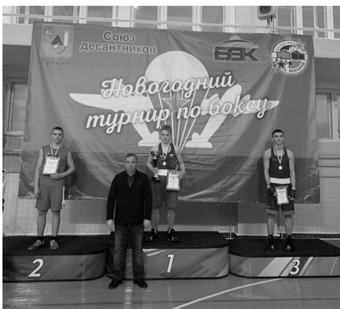
Победители новогоднего турнира