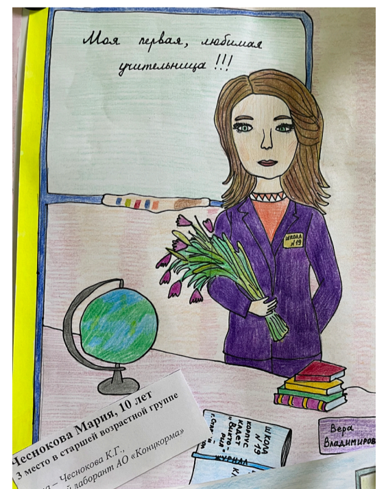
3 МЕСТО В СТАРШЕЙ ВОЗРАСТНОЙ ГРУППЕ