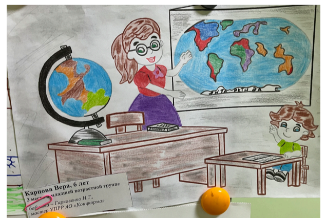
3 МЕСТО В МЛАДШЕЙ ВОЗРАСТНОЙ ГРУППЕ