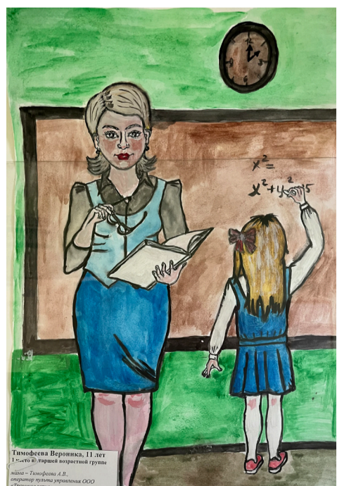
1 МЕСТО В СТАРШЕЙ ВОЗРАСТНОЙ ГРУППЕ