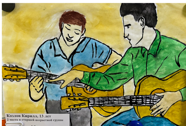
2 МЕСТО В СТАРШЕЙ ВОЗРАСТНОЙ ГРУППЕ