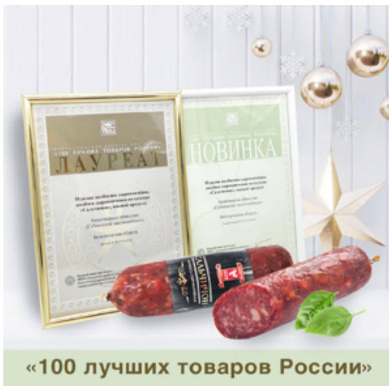
«100 лучших товаров России»

Также объявлены победители федерального этапа конкурса «100 лучших товаров России». Программа «100 лучших товаров России», реализуемая в сотрудничестве с Минпромторгом России и Росстандартом, – общественно-государственный проект, оказывающий значительное положительное воздействие на повышение качества товаров, работу предприятий и в целом