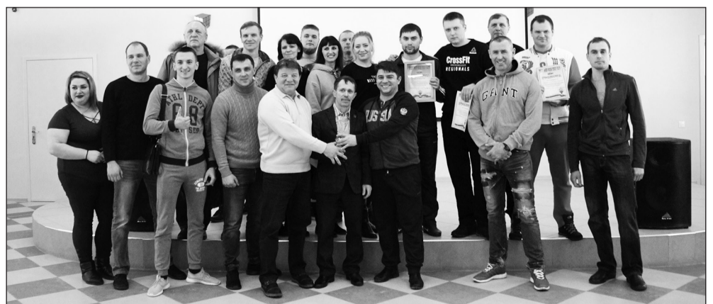
▲ Победитель XV, юбилейной спартакиады – команда АО «Губкинский мясокомбинат» получила хрустальный кубок – приятный символ гордости и спортивного успеха в окружении коллег.