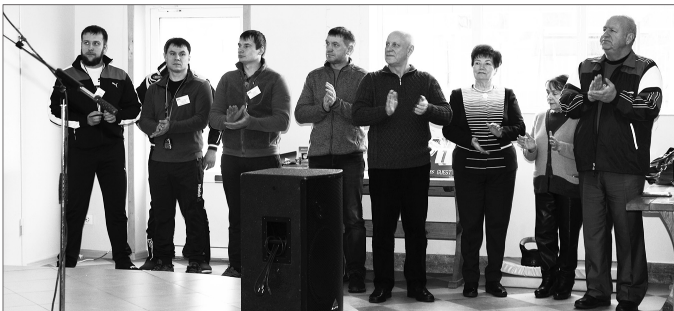
▲ Церемония открытия корпоративной спартакиады.

23 февраля для многих сотрудников Агропромышленной группы БВК не просто День защитника Отечества, а большой спортивный праздник. Уже 15 лет эта дата является и днём проведения корпоративной спартакиады. На базе отдыха «Славянка», где прошло это увлекательное спортивное мероприятие, его участники смогли продемонстрировать свои возможности в силе, ловкости, мастерстве, а также провести время с пользой, пообщаться с коллегами в неформальной обстановке.