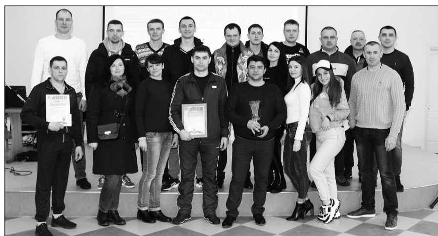
▲ Победитель 16-й спартакиады – команда АО «Губкинский мясокомбинат».

16-я корпоративная спартакиада длилась несколько часов, в течение которых на разных площадках проводились спортивные соревнования. Каждый этап состязаний вызывал шквал эмоций. Болельщики активно поддерживали спортсменов. Участники спартакиады показали не только личные спортивные достижения, но и прекрасную коллективную работу, принеся своей команде достойные результаты в различных видах спорта.