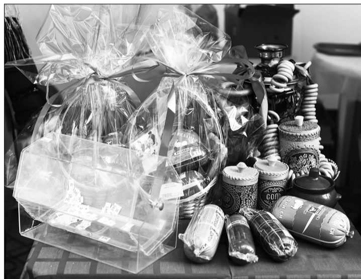
▲ Такие вкусные подарки от Губкинского мясокомбината смогли выиграть куряне на Масленицу!