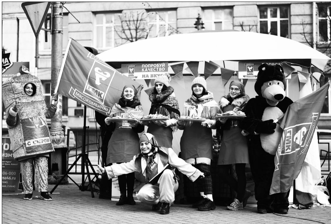
▲ На Театральной площади в Курске 29 февраля было весело и аппетитно!

Большая культурная программа с театрализованными представлениями, красивой музыкой, хороводами и вкусными угощениями подарила всем жителям массу позитивных эмоций. Мероприятие завершилось сжиганием чучела Масленицы по старинному обычаю. Этот яркий кульминационный момент праздника символизирует уход зимы и наступление долгожданной весны.