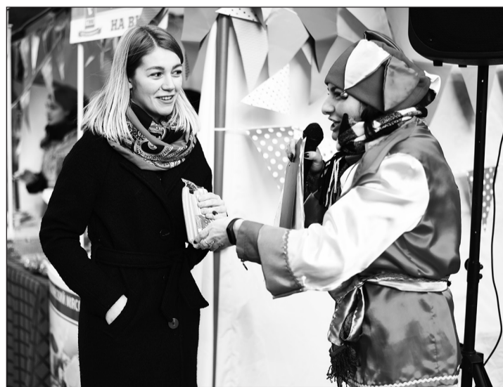
▲ Возле шатра Губкинского мясокомбината в Курске было многолюдно. Участники конкурсов получали в качестве призов колбасные изделия.

◀ На центральной площади Губкина 1 марта жители и гости города с размахом отметили провода русской зимы. В рамках масленичных гуляний состоялась дегустация продукции Губкинского мясокомбината. И взрослые, и дети с большим удовольствием полакомились бутербродами с колбасой.