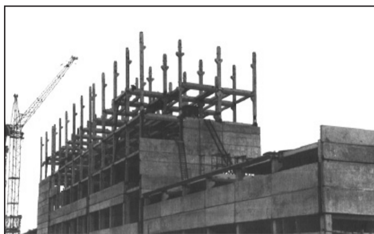
▲ Троицкий комбикормовый завод. Главный корпус. Вид со стороны склада премиксов. Ось «Г». 18.07.1972 г.

Каждый год вносит что-то новое в производство. По сути, реконструкция не останавливается и по сегод-