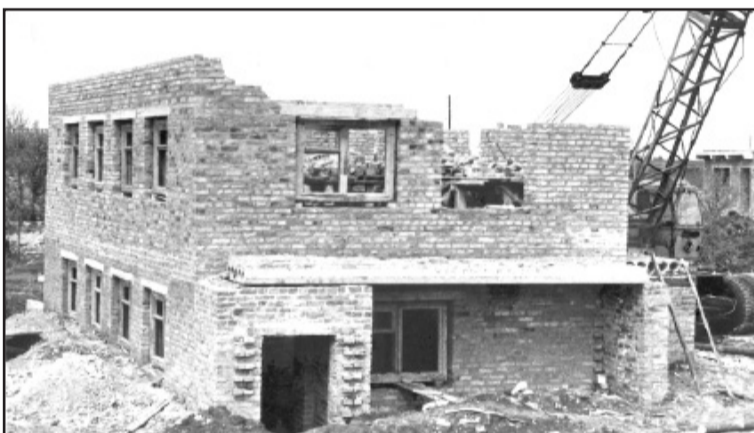
▲ Троицкий комбикормовый завод. Приёмная лаборатория с визировочной площадкой. 10.05.1972 г.

Каждый год вносит что-то новое в производство. По сути, реконструкция не останавливается и по сегод-