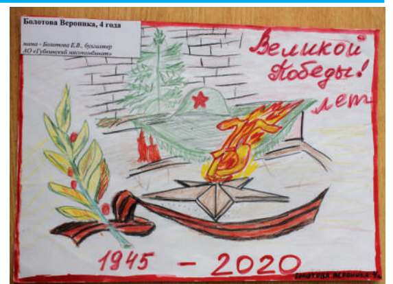
Болотова Вероника, 4 года