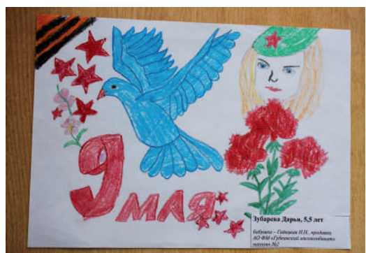
Зубарева Дарья, 5 лет