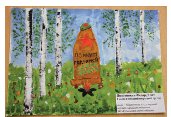
1 место в младшей группе Половинкин Фёдор, 7 лет