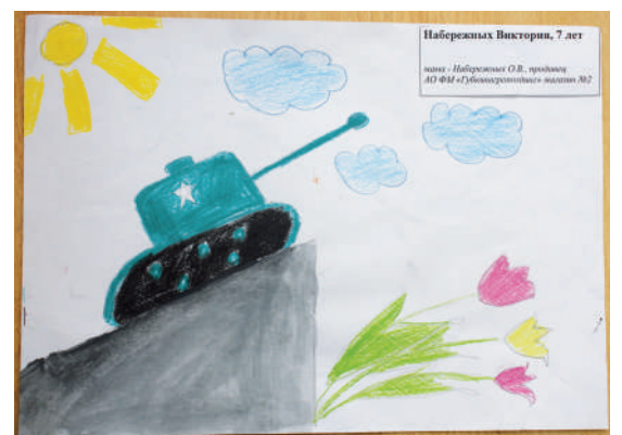
Набережных Виктория, 7 лет