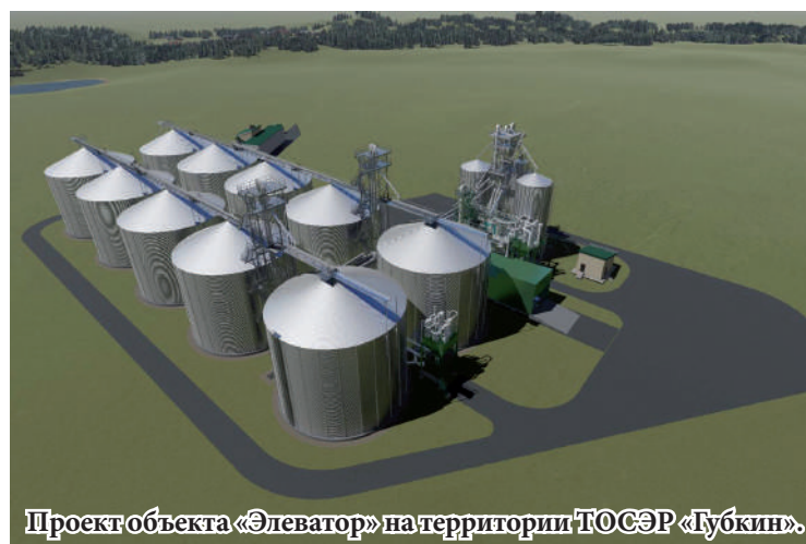
Проект объекта «Элеватор» на территории ТОСЭР «Губкин».

В рамках генерального соглашения между правительством Белгородской области