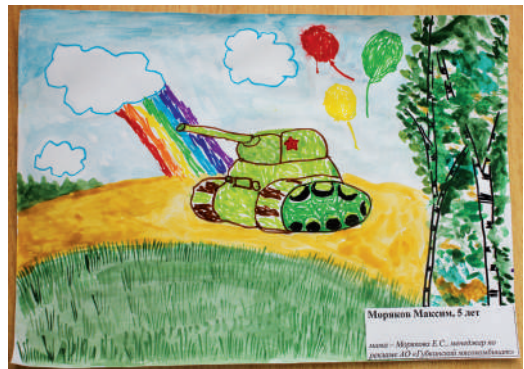
Моряков Максим, 5 лет