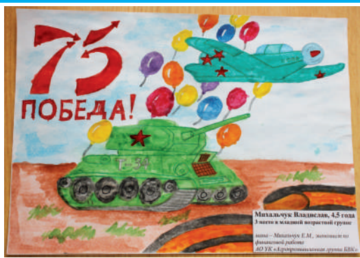
3 место в младшей группе Михальчук Владислав, 4 года