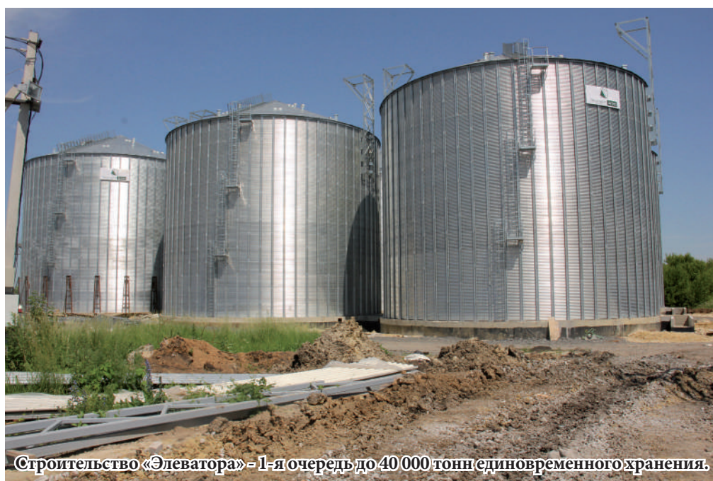
Строительство «Элеватора» - 1-я очередь до 40 000 тонн единовременного хранения.