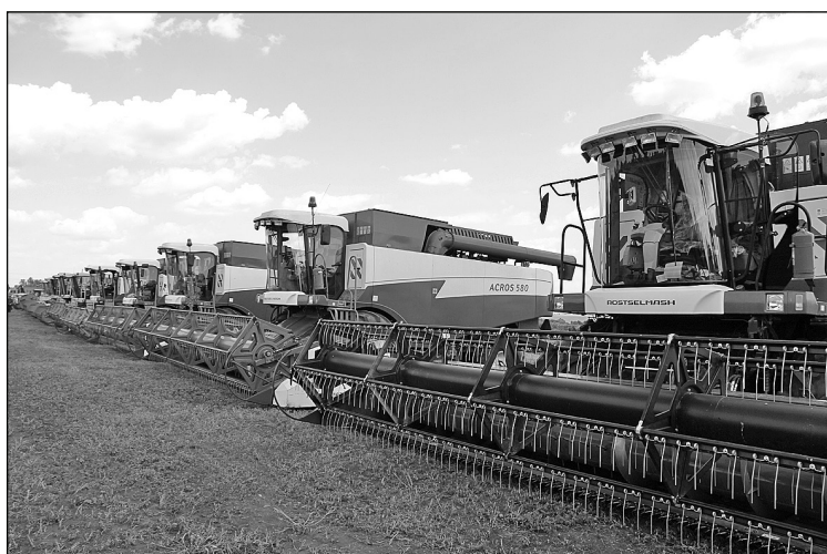
▲ Комбайны к уборочной страде готовы.