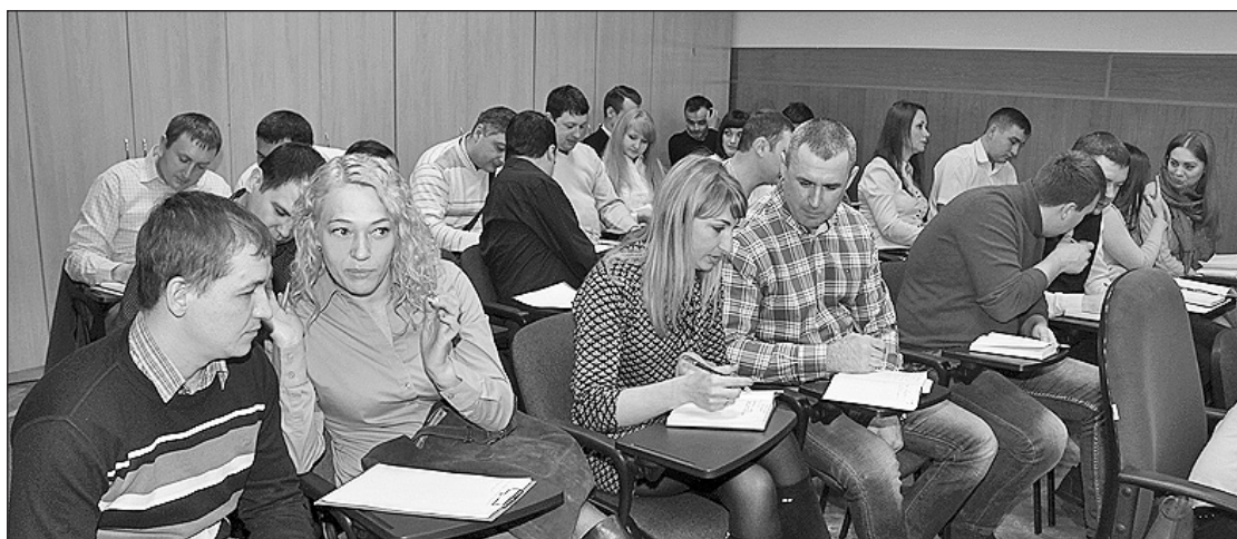
▲ На занятиях по повышению эффективности продаж сотрудники коммерческих подразделений решают практические задачи.

Поздравляя с профессиональным праздником, хочется пожелать нашим сбытовикам дальнейшего роста профессионализма и значительного увеличения продаж, а также появления новых выгодных клиентов!