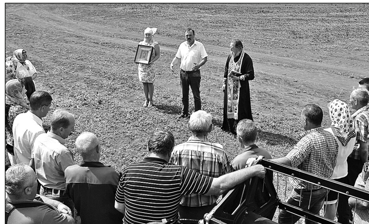
▲ Собрание коллектива перед началом уборки.