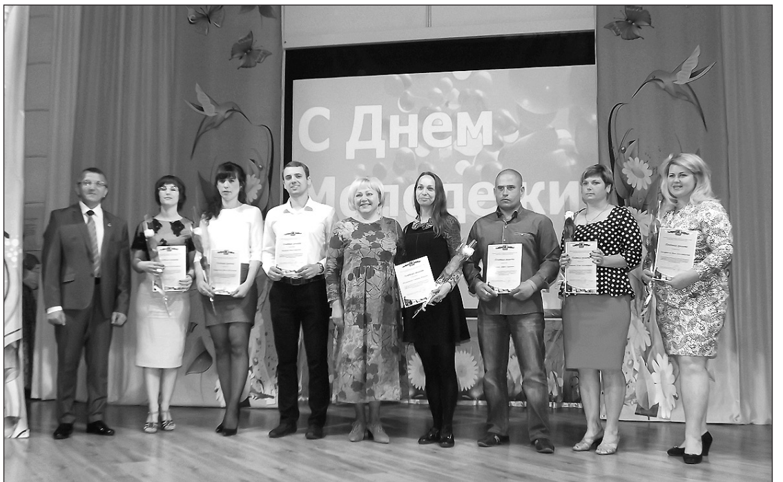
▲ Церемония награждения: снимок на память.