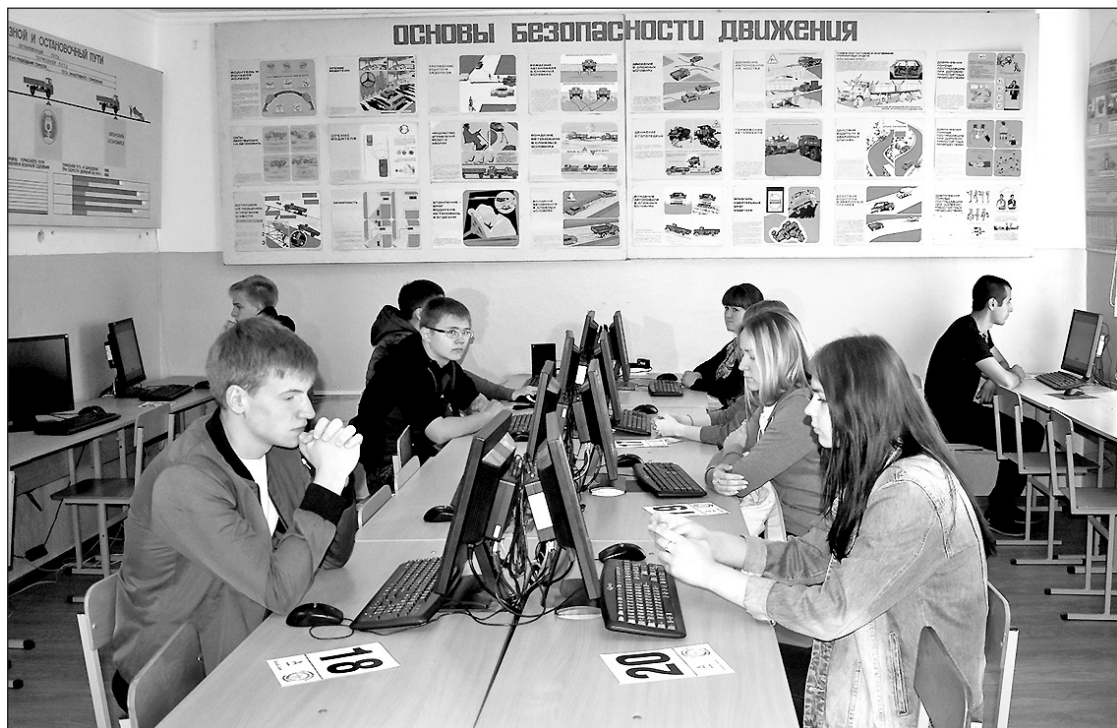
▲ В ходе соревнований «Чемпион ПДД!» определялись участники, лучше всех знающие правила дорожного движения.

8 июля, в День семьи, любви и верности, в Старом Осколе в автошколе ДОСААФ прошли соревнования «Чемпион ПДД!». Одним из спонсоров этого мероприятия выступила агропромышленная группа БВК.