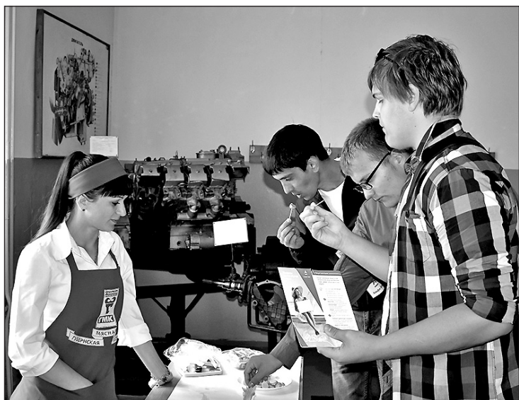
▲ Дегустация колбасных изделий торговой марки «Губернская мясная компания». Посетители узнали о новых видах продукции. И вкусно, и познавательно!

Л. КОПТЕВА, менеджер по маркетингу АО «БВК трейд», фото автора и участников соревнований