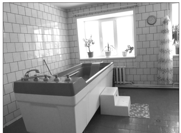
▲ Полное расслабление человека является первым положительным эффектом гидромассажа.