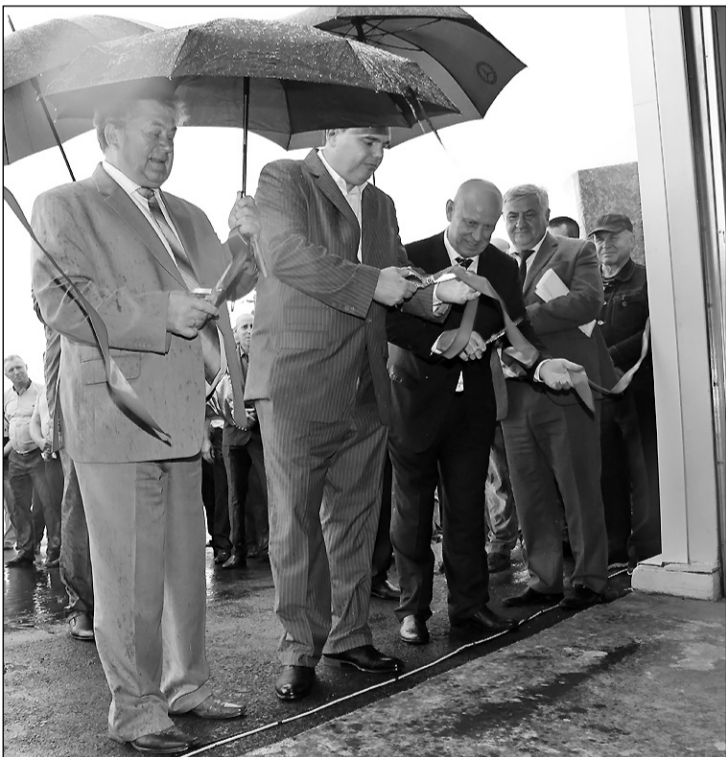
▲ Символический старт работы нового комплекса: разрезание красной ленты – последнего препятствия на пути предприятия к успеху.